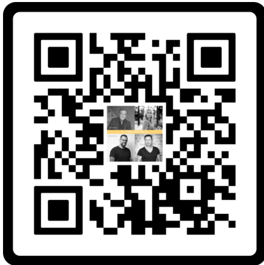
4 your Business