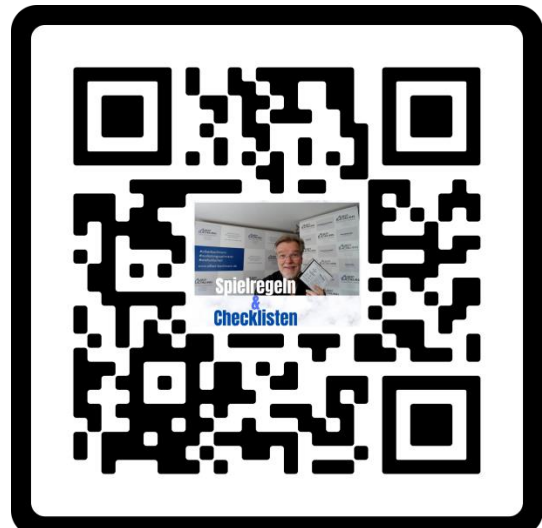
Spielregeln & Checklisten