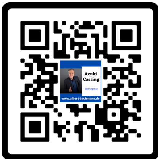
Azubi Casting – Das Original