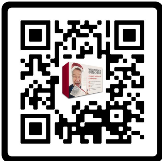
Gutscheine verkaufen und Kunden binden