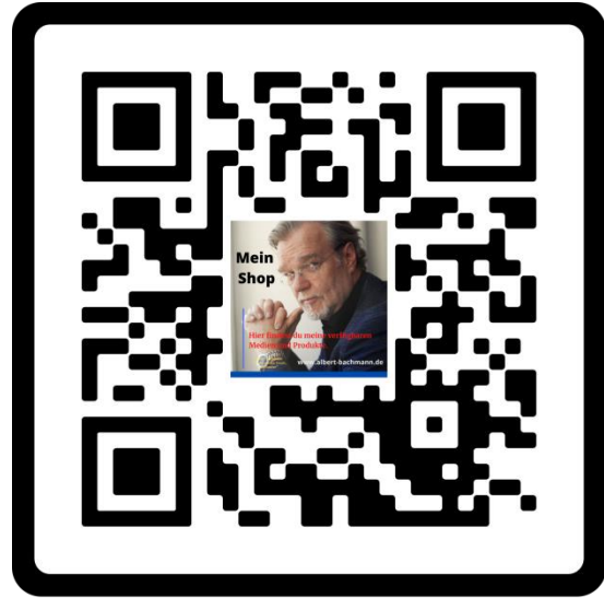
Mein Medien Shop